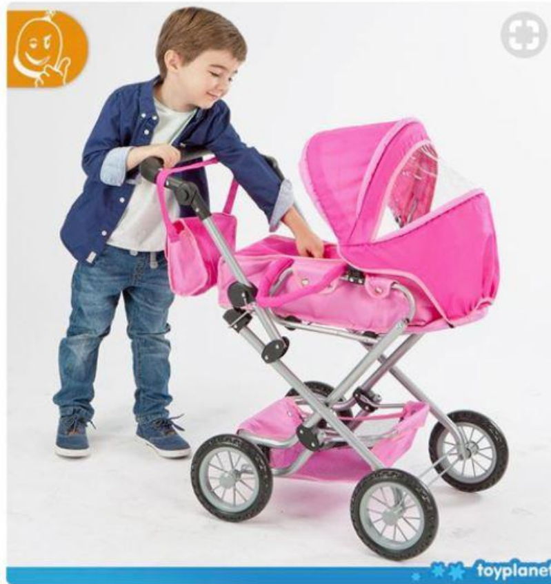
▲ 토이 플래닛 핀터레스트